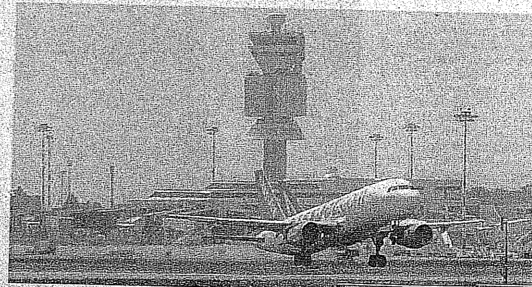
Il destino di Malpensa dopo il decreto Lupi allarma una volta di più il territorio del sedime VARESEPRESS

Ebbene, «nemmeno le briciole ci arrivano per intero, visto che dal 1999 mancano all'appello 42 milioni di euro complessivi, per tutti i Comuni