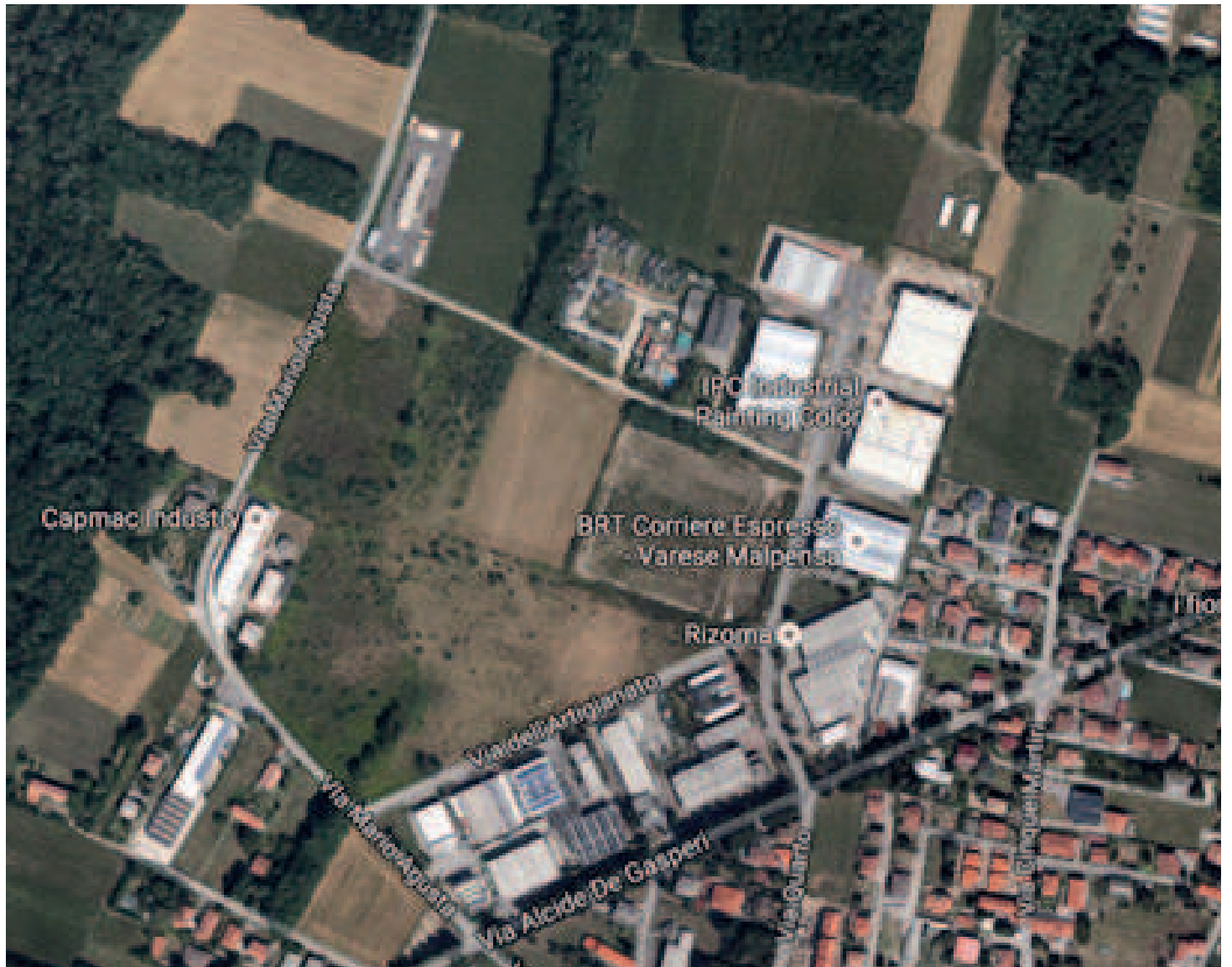
Estratto da Google Maps